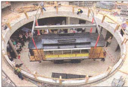
Behutsam setzt der Kran die alte Helene ab. Nun kann über ihr die Glaskuppel errichtet werden.

auf dem Postplatz von 1900 zu sitzen – Bei urig sächsischen Köstlichkeiten und Radeberger Bier und zum Teil auf alten Straßenbahnbänken.“ KK