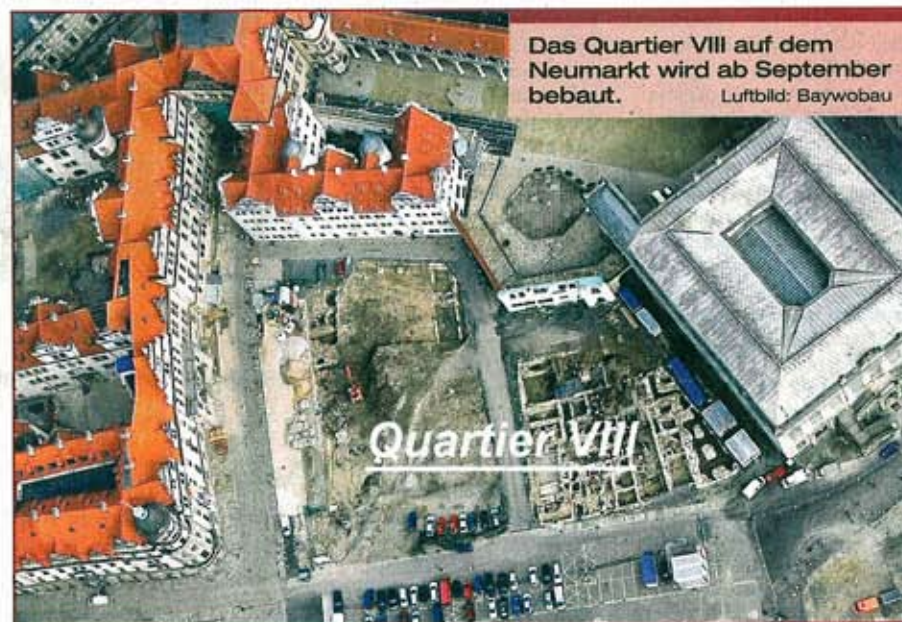
Das Quartier VIII auf dem Neumarkt wird ab September bebaut.