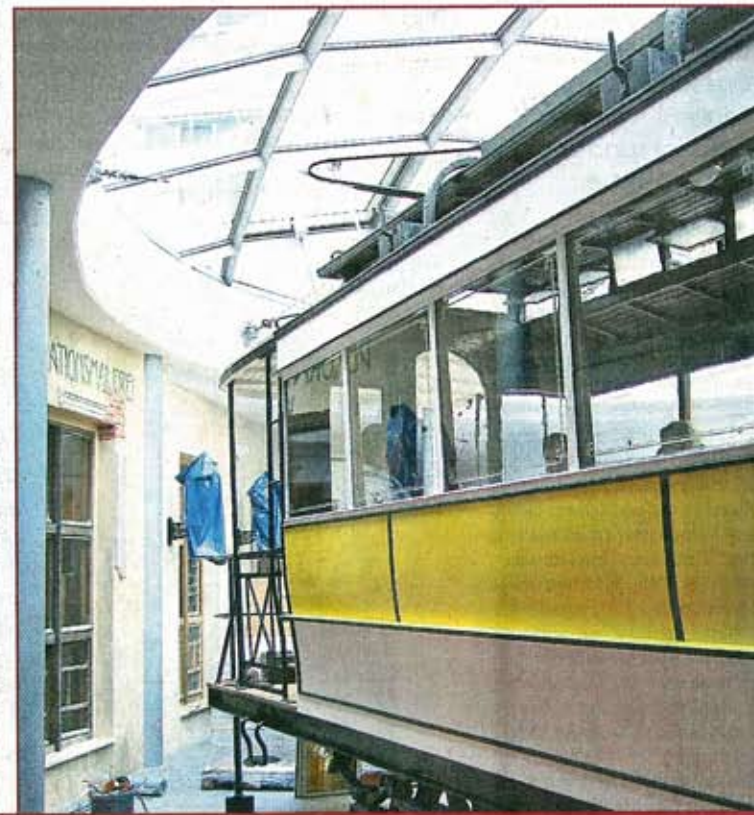
Ob Haute Couture oder Erlebnisgastronomie – das Quartier III lebt auch von seiner Einmaligkeit.