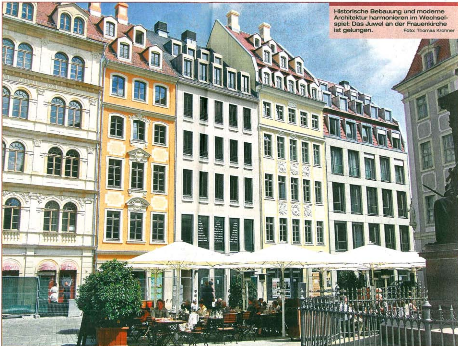
Historische Bebauung und moderne Architektur harmonieren im Wechselspiel: Das Juwel an der Frauenkirche ist gelungen.

Das Wechselspiel des Jewels zwischen historischen Leitfassaden und zeitgemäßen, ja modern anmutenden Gebäudehüllen, die sich in Form und Proportion ihren Vorgängern harmonisch anpassen, darf ohne Zweifel als gelungen bezeichnet werden. Mehr noch: Die historischen Visitenkarten werden durch das beeindruckende Zusammenwirken optisch herausgehoben und erhöht. Das ist architektonisch stimmig und besitzt Charakter. Und es setzt Maßstäbe für Kommenendes auf diesem sensiblen Areal. Der historische Duktus der prägenden Architektur – Dächer, Gauben, Gebäudehöhen – wurde wieder aufgenommen. Mit dem Juwel wachsen die Quartiere rund um die Frauenkirche weiter zusammen. Das Juwel ist ausdrucksstark und prägend. Der Dresdner Architekt Gunter Just, über Jahre hinweg Dezernent für Stadtentwicklung sowie Vorsitzender der